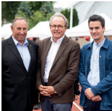
Étienne Lengereau , Maire de Montrouge Président de Vallée Sud - Grand Paris (au centre)